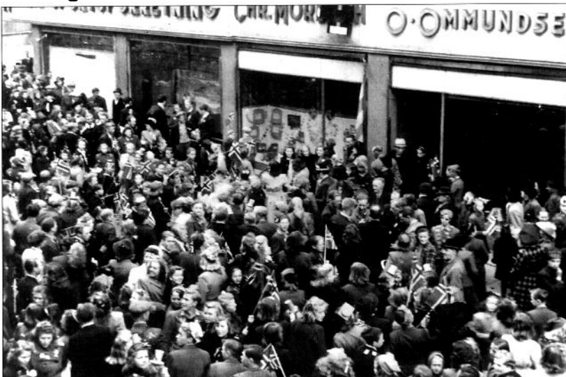
8. mai 1945. Folk samlet seg i gatene.

Vi hadde vært spente på bryllupsmiddagen,- men det ble virkelig kinkestek.